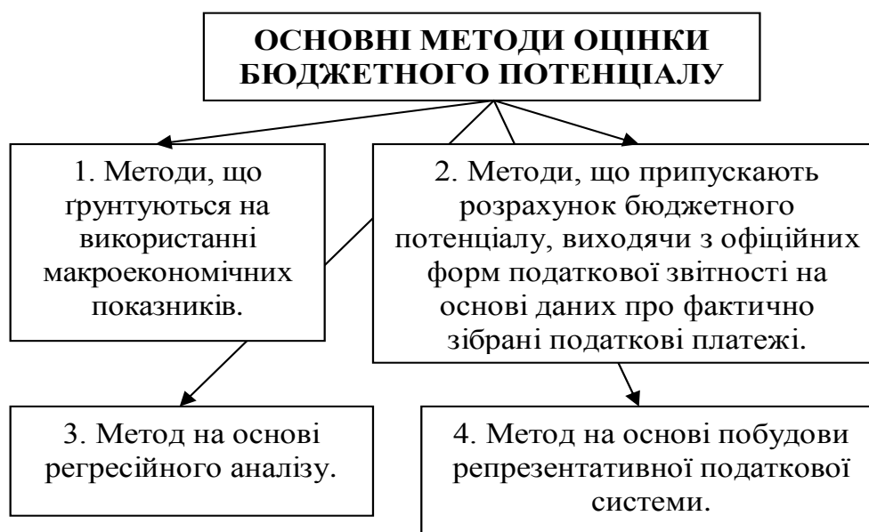
Рис. 3. Основні методи оцінки бюджетного потенціалу

отриманих доходів: додавання трансфертів, отриманих резидентами з державного бюджету, доходів фізичних осіб-резидентів від роботи за межами регіону, доходів від підприємницької діяльності, отриманих за межами регіону [17]. Ще одним параметром, що дозволяє оцінити забезпеченість регіону бюджетними доходами, є вироблений дохід. Цей показник являє собою «суму первинних доходів усіх секторів економіки, отриманих у результаті участі у виробництві регіонального продукту на даній території» [4]. Інакше кажучи, вироблений дохід є сумою валових доданих вартостей галузей економіки і чистих податків на продукти, або валовий регіональний продукт. Таким чином, вироблений дохід охоплює основний обсяг бюджетних ресурсів регіону і може вважатися показником, що цілком адекватно відображає бюджетний потенціал. Головним недоліком цієї групи методів є те, що показники, які ґрунтуються на використанні макроекономічних показників, можуть дати тільки приблизну оцінку бюджетного потенціалу регіону. Тому їх використання для планування власних доходів бюджетів регіонів, а також визначення їх бюджетної забезпеченості не є цілком прийнятним.