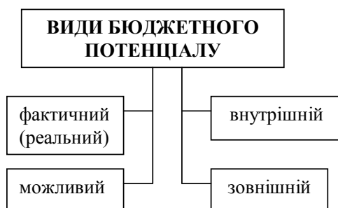
Рис. 1. Види бюджетного потенціалу

Бюджетний потенціал може бути фактичним (реальним) і можливим, внутрішнім і зовнішнім (рис. 1) [28]. Охарактеризуємо кожен зі згаданих видів, щоб краще розуміти сутність зазначеної економічної категорії.