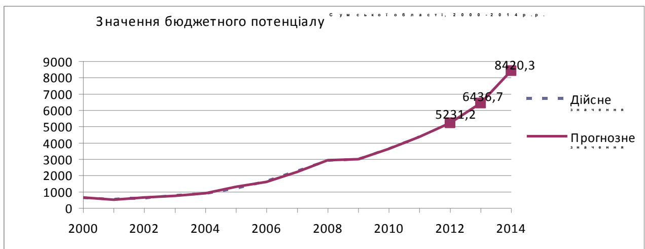
Рис. 4. Значення бюджетного потенціалу (млн. грн.) [22]

Будуємо графік зміни бюджетного потенціалу на історичному інтервалі (рис. 4), а також значення бюджетного потенціалу, отримані з використанням регресійного рівняння в інтервалі 2012-2014 рр.